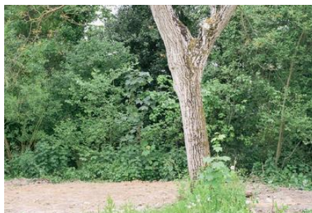
Pierre-Yves Racine Série Disparitions, tirages chromogènes (un tirage chromogène est un procédé de développement traditionnel photographique. Il s'agit d'un tirage sur papier fait à partir d'un négatif couleur) 64x48cm

« J'ai photographié les cabanes des jardins ouvriers peu après leur abandon par les jardiniers. Lorsqu'elles ont disparu, j'ai recherché mon point de vue d'origine pour le reconduire. Le cadre de l'image est déterminé par un sujet qui n'existe plus. La nouvelle série nous amène à contempler un paysage vide de ce qui le constituait, de ce qui avait suscité l'image ».